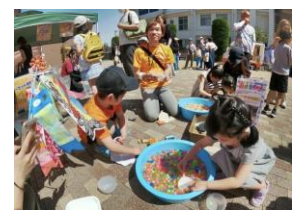
こどもの日に開催した「遊ぼうday」では、たくさんの親子連れに参加していただきました！