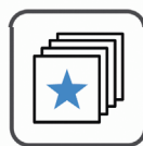
フラッシュカード